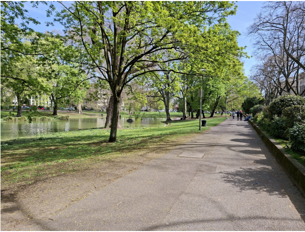
Park am Ebertplatz