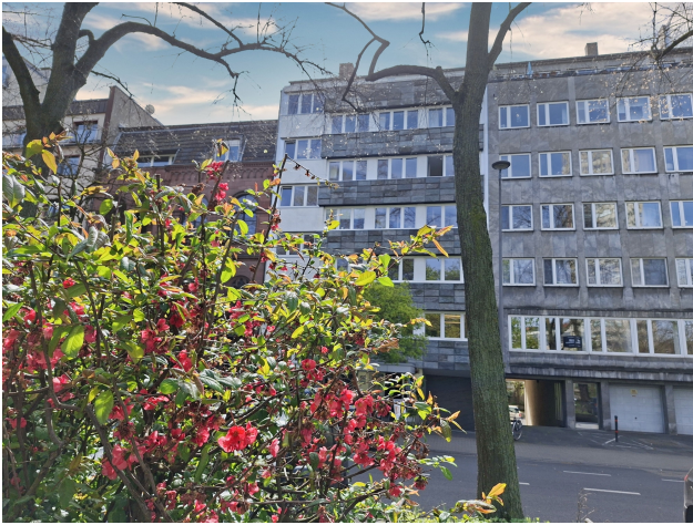
Vorderansicht Wohn- und Geschäftshaus