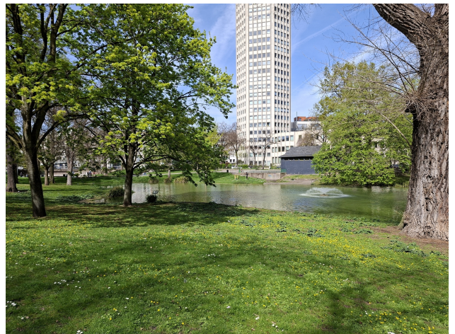
Park am Ebertplatz