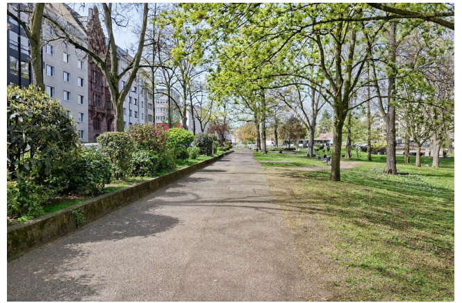
Direkt gegenüber Baumgesäumter Weg im Park