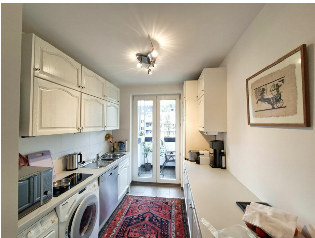
Küche mit Zugang zum Balkon