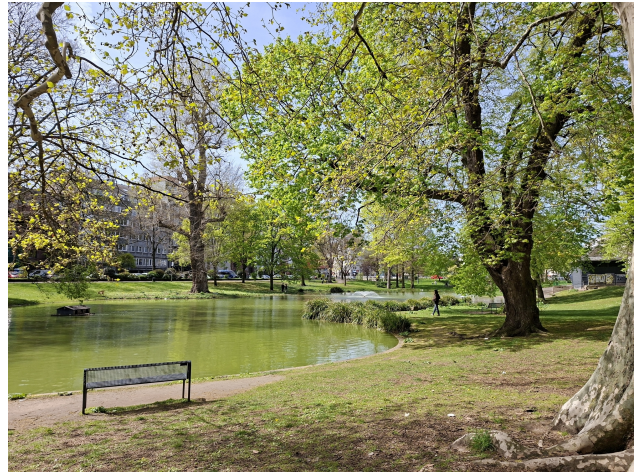
Park am Ebertplatz