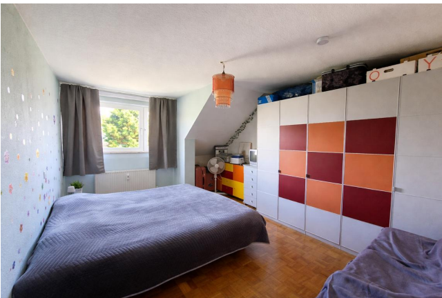
Schlafzimmer zur Gartenseite