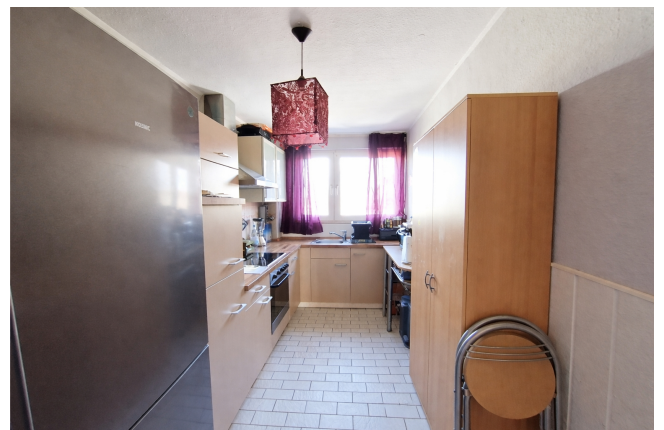
Küche zur Gartenseite