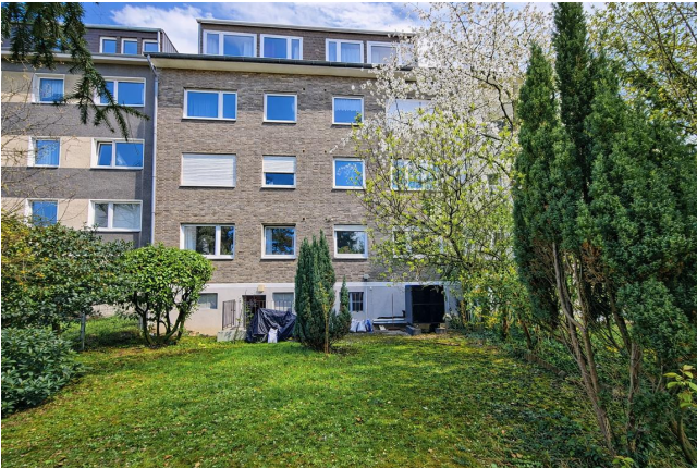
Rückseite Haus mit Garten