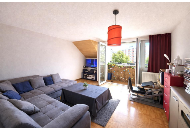
Wohnzimmer mit Parkett