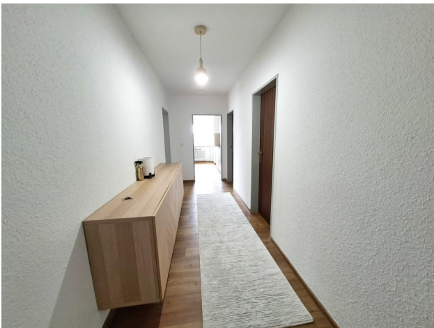
Wohneinheit 1. OG rechts