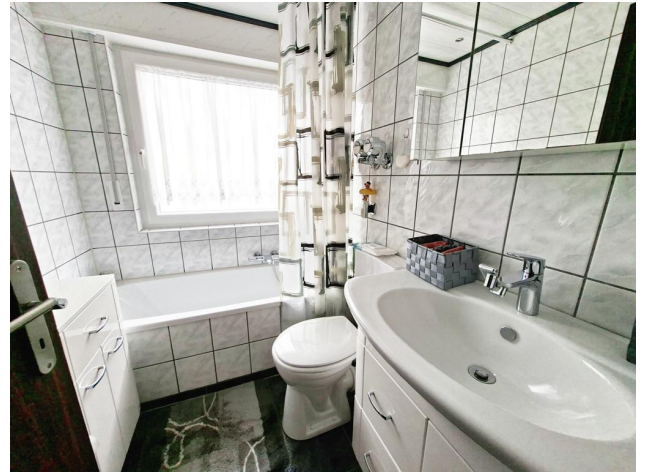
Wohneinheit EG rechts