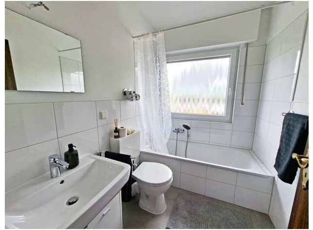
Wohneinheit 1. OG rechts