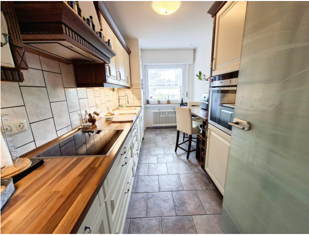
Wohneinheit EG rechts