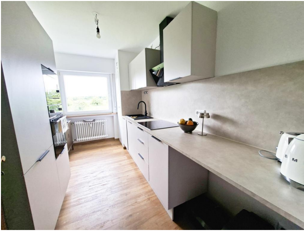
Wohneinheit 1. OG rechts