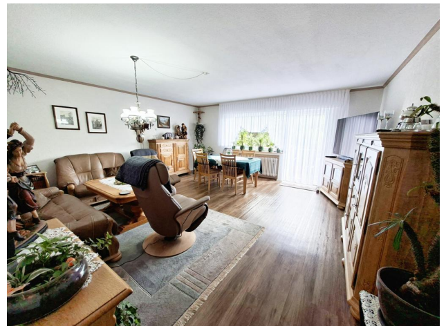
Wohneinheit EG rechts