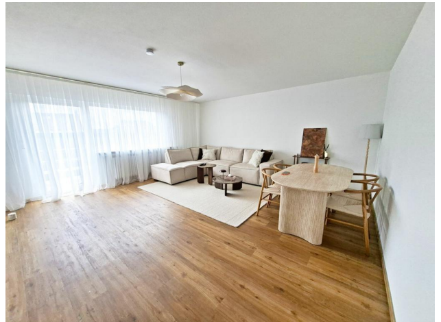
Wohninheit 1. OG rechts