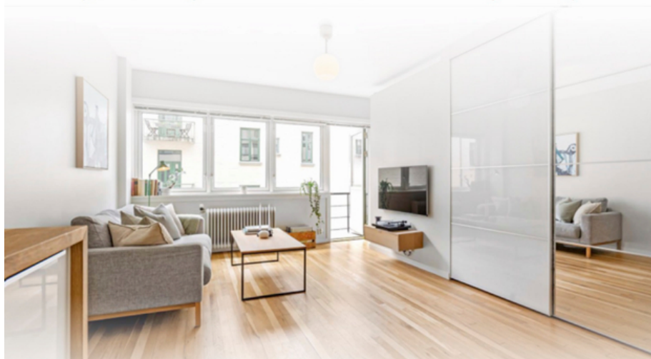
Auszeichnungen Cityhouse Immobilien