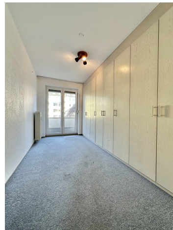
Kinder oder Arbeitszimmer