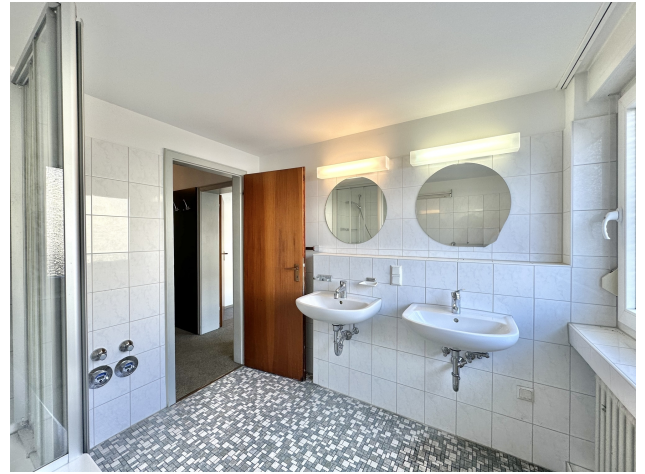
Mit zwei Waschbecken