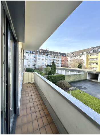
2. Balkon zum Hinterhof