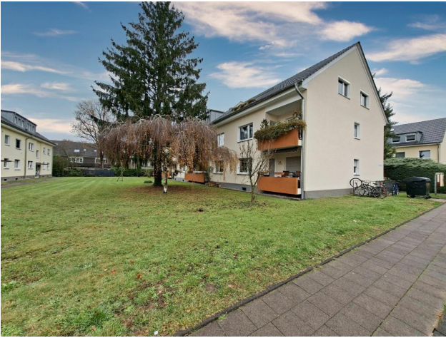
Gemeinschaftsgarten / Rückansicht Haus