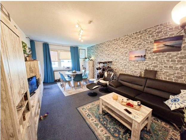
Wohn- und Esszimmer mit Zugang zum Balkon