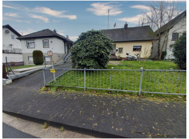
Zufahrt Straße zum Grundstück