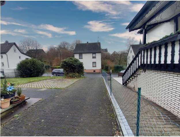
Seitliche Zufahrt Grundstück