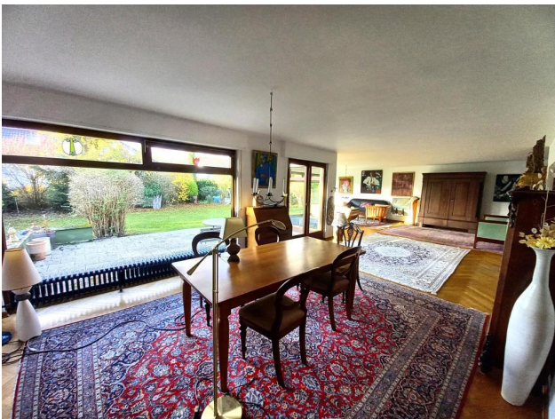
Ausblick in den Garten