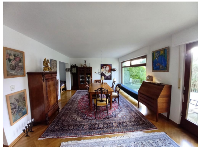
Essbereich mit Blick in den Garten