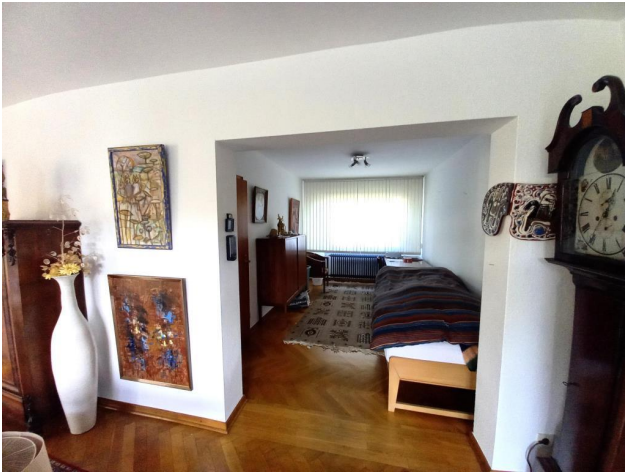
Schlafzimmer oder Büro