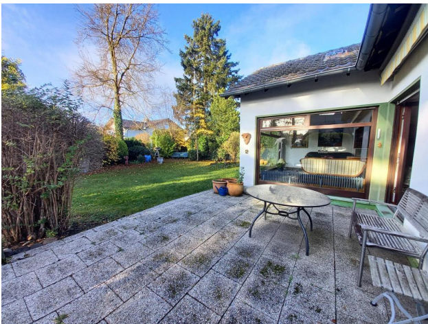
Große Terrasse mit Markise