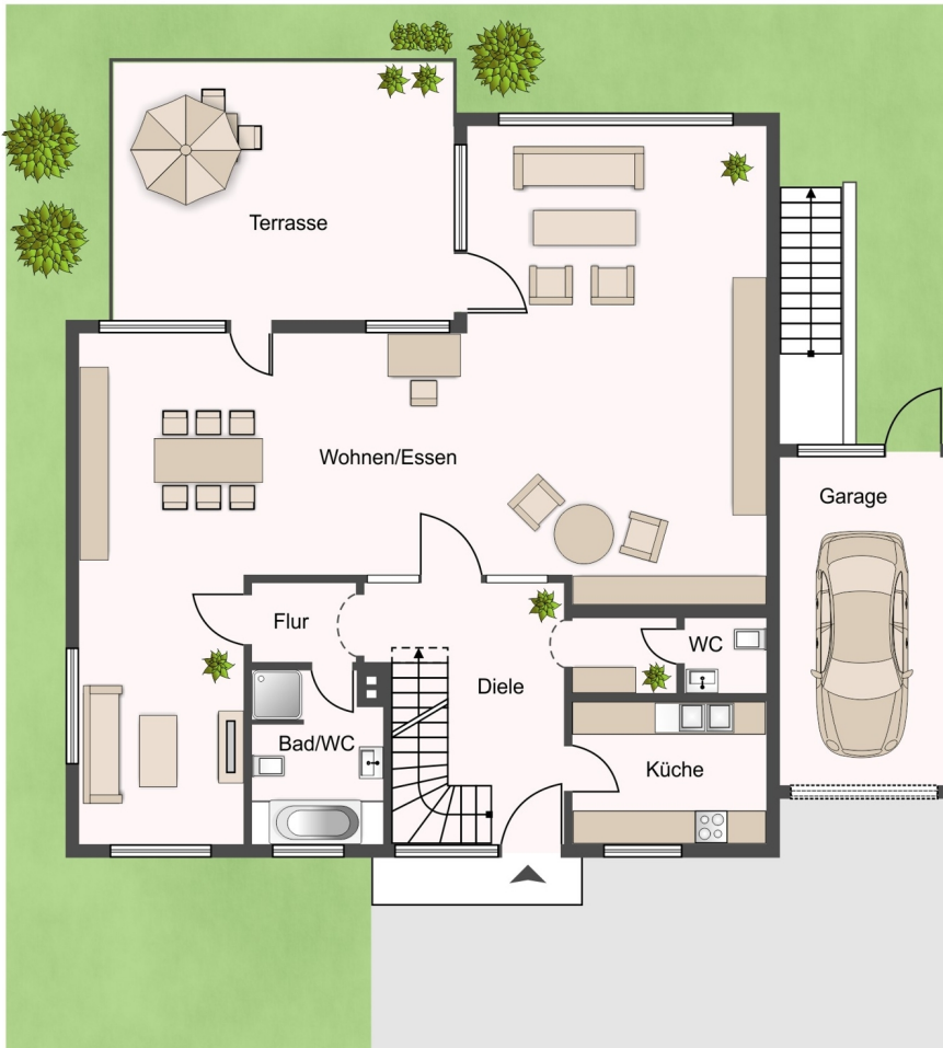
Grundriss EG mit Terrasse und Garten