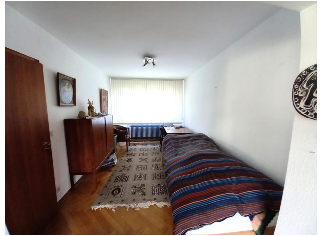
Schlafzimmer oder Büro