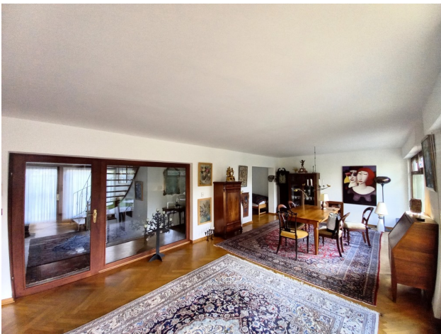
Große Glastüre vom Flur ins Wohnzimmer