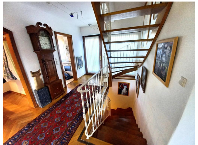
Eingangsbereich mit Treppe zum Dachgeschoss und Keller