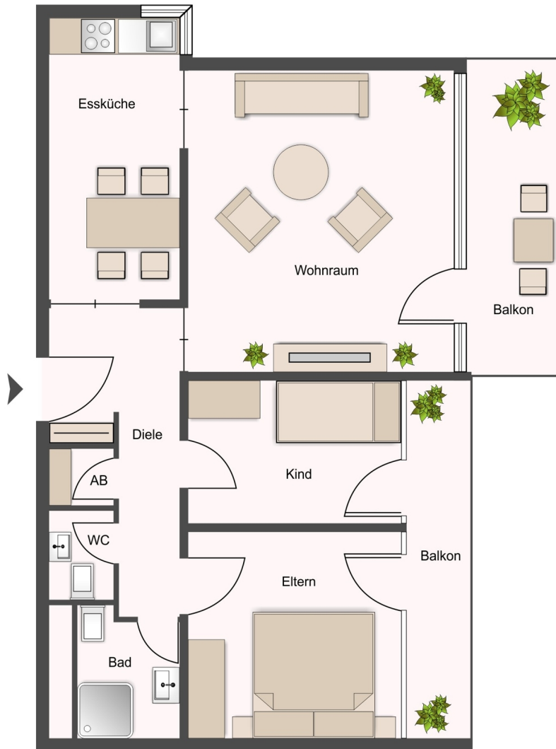
Wohnung 6. OG mit 2 Balkonen