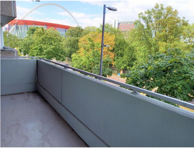
Balkon mit Aussicht