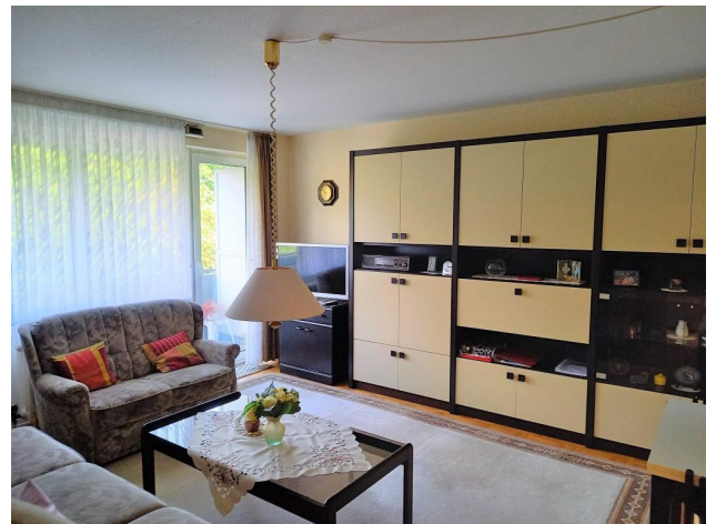
Helles Wohnzimmer mit Balkon