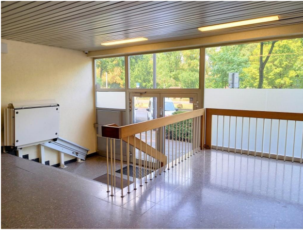
Eingang mit elektrischem Treppenlift