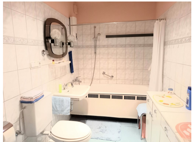
Wannenbad mit Waschmaschinenanschluss