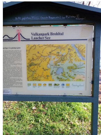
Wanderkarte Laacher See