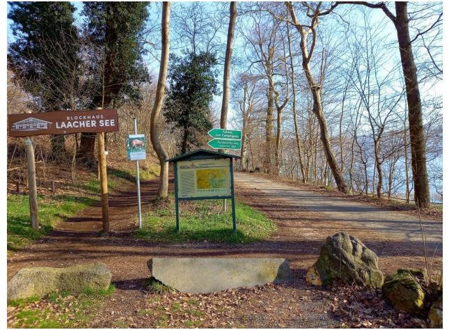
3 Km bis zum Laacher See