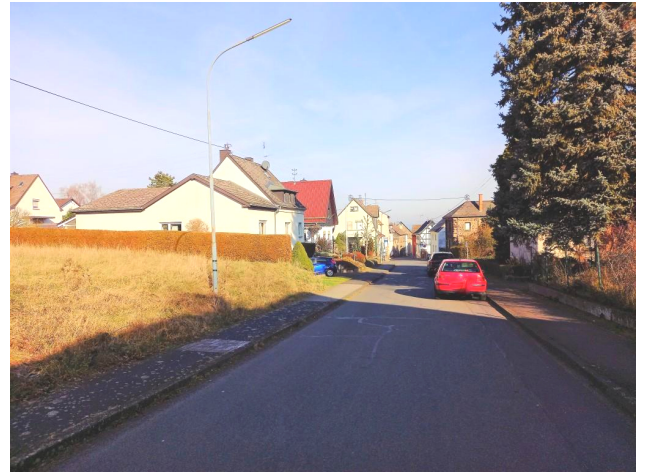
§ 34 BauGB