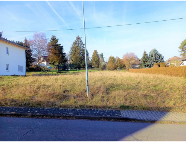
Ca. 1.085 m 2 Grundstücksfläche